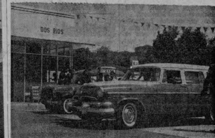
Tan pronto abrió sus puertas el nuevo servientro de la Esso en el barrio Santa Marta, empezaron a desfilan los vehículos que deseaban la famosa gasolina Poderamic y el aceite Esso Extra.