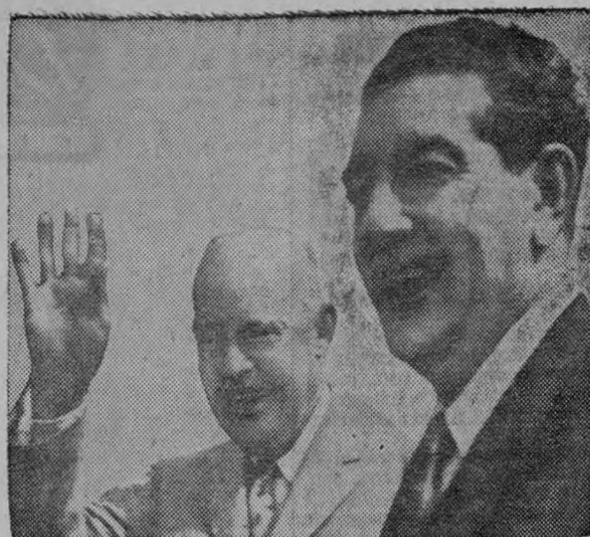
MEXICO Y EE. UU. "SE CONOCEN".— El Presidente Eisenhower aparece aquí con el Presidente Adolfo López Mateos, de México, al comienzo de las amistosas conversaciones entre ambos en Acapulco. Bandas militares interpretan los himnos nacionales de ambos países durante los honores de la bienvenida en el aeropuerto de la gran ciudad veraniega mexicana. Eisenhower fue acompañado en la conferencia por su hermano menor, el Dr. Milton Eisenhower.